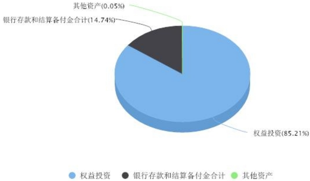
投资组合资产配置图表 数据截止日期:2023年09月30日