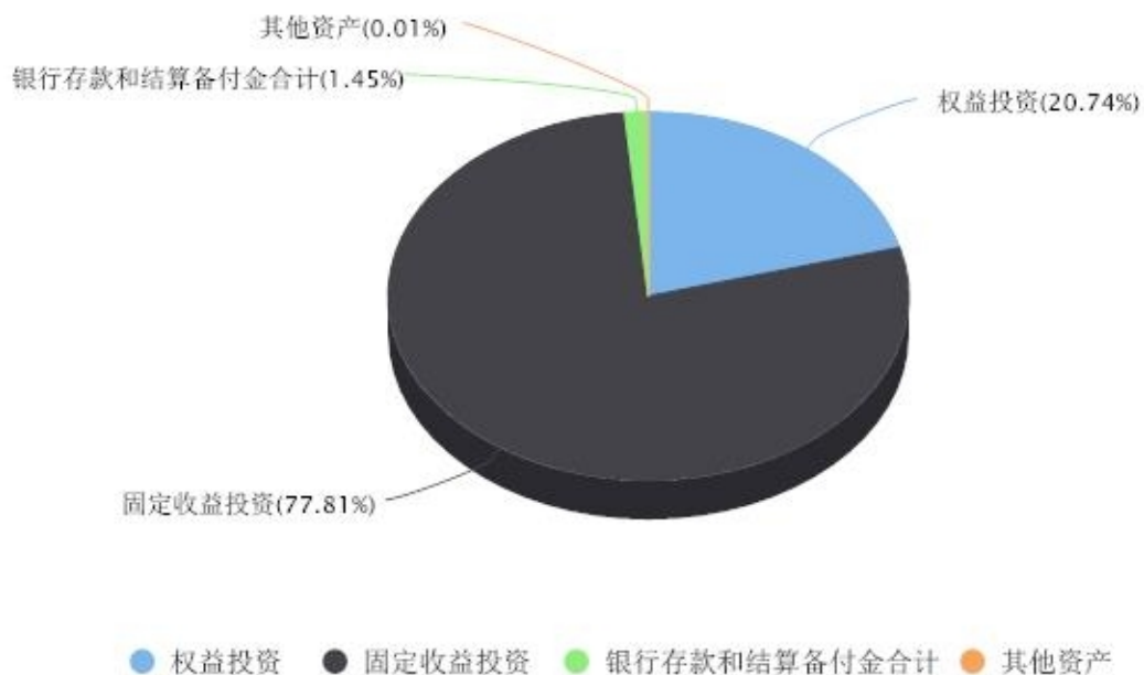
投资组合资产配置图表 数据截止日期:2023年12月31日