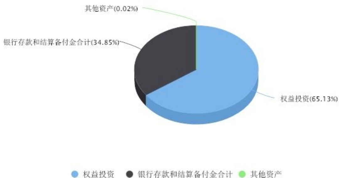
投资组合资产配置图表 数据截止日期:2022年12月31日