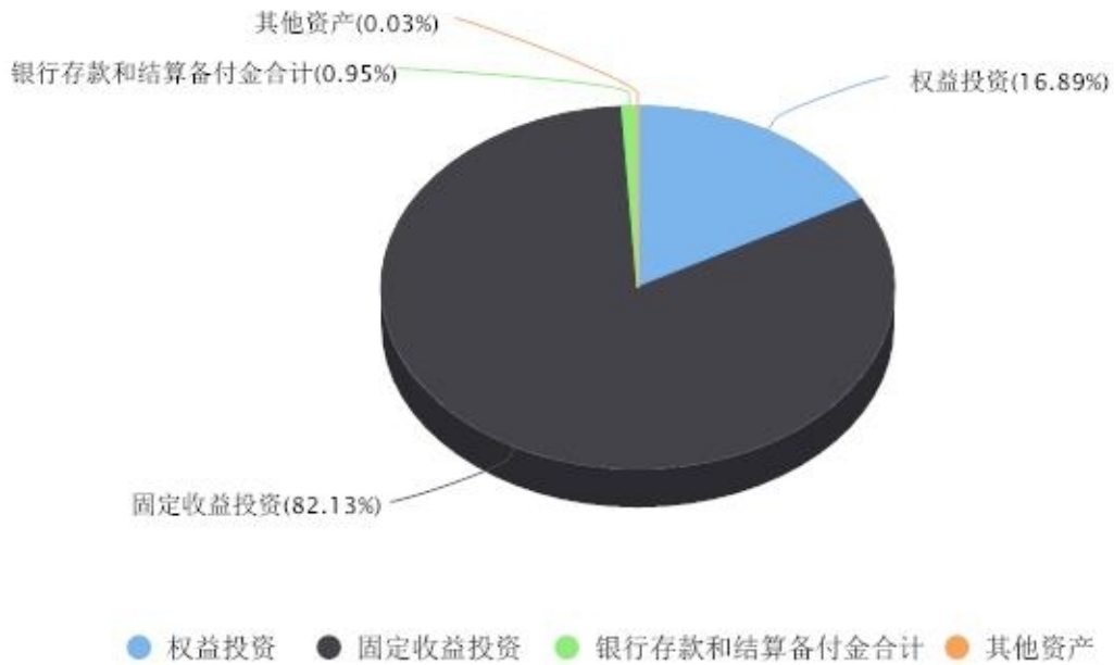
投资组合资产配置图表 数据截止日期:2023年09月30日