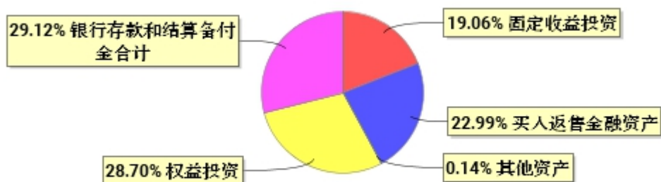
投资组合资产配置图表(2023年3月31日)

● 固定收益投资 ● 买入返售金融资产 ● 其他资产 ● 权益投资 ● 银行存款和结算备付金合计