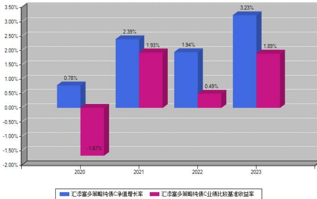
汇添富多策略纯债C每年净值增长率与同期业绩基准收益率对比图

注：基金的过往业绩不代表未来表现。本《基金合同》生效之日为2020年04月01日，合同生效当年按实际存续期计算，不按整个自然年度进行折算。