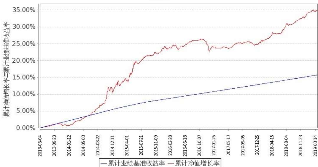
图2：嘉实如意宝定期债券 C 基金份额累计净值增长率与同期业绩比较基准收益率的历史走势对比图