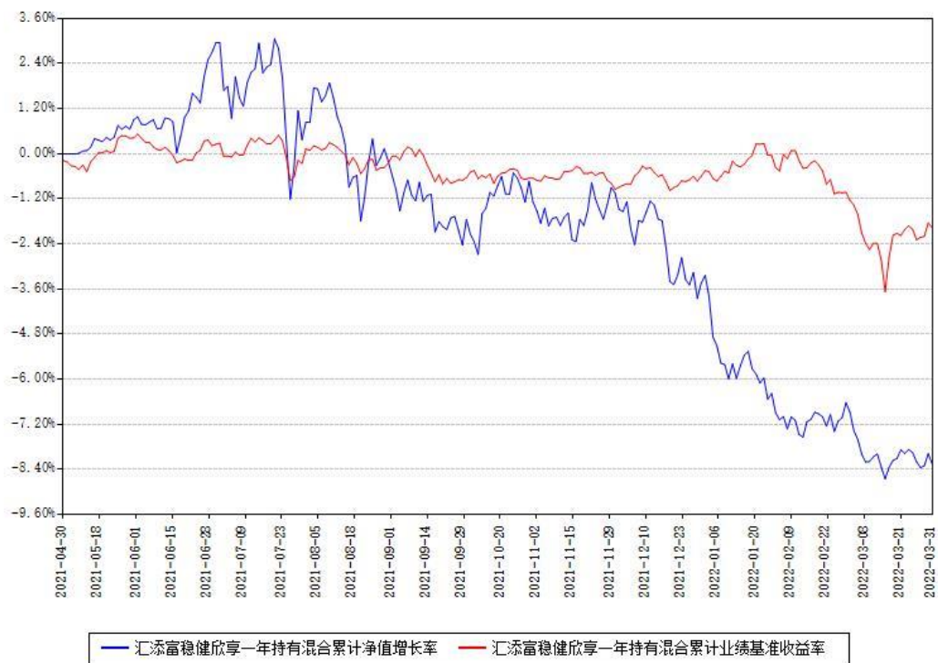
汇添富稳健欣享一年持有混合累计净值增长率与同期业绩基准收益率对比图