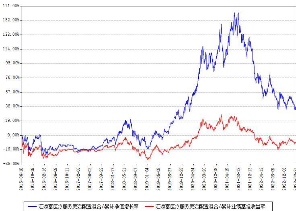
汇添富医疗服务灵活配置混合A累计净值增长率与同期业绩基准收益率对比图

(二) 自基金合同生效以来基金累计净值增长率变动及其与同期业绩比较基准 收益率变动的比较图