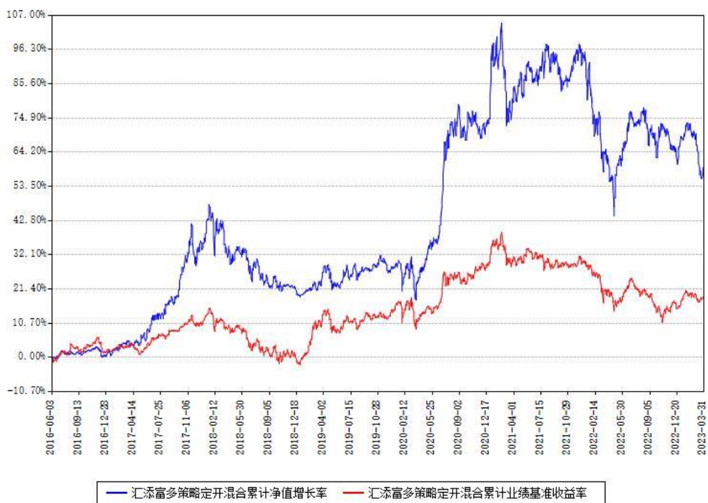
汇添富多策略定开混合累计净值增长率与同期业绩基准收益率对比图