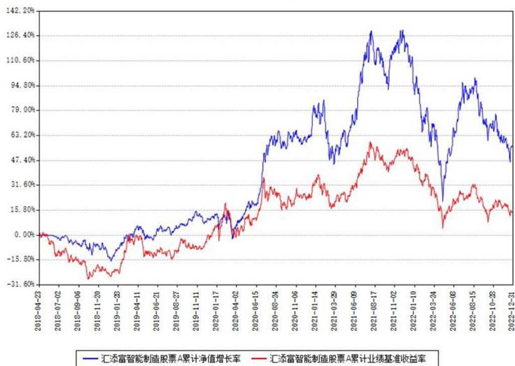
汇添富智能制造股票A累计净值增长率与同期业绩基准收益率对比图

(二)自基金合同生效以来基金累计净值增长率变动及其与同期业绩比较基准收益率变动的比较图