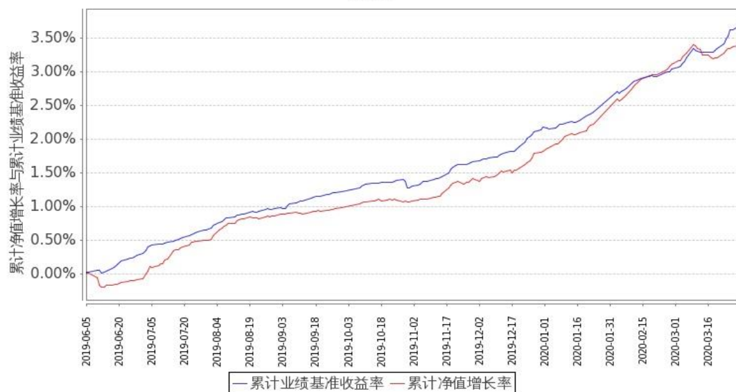
图2：嘉实汇达中短债债券C基金份额累计净值增长率与同期业绩比较基准收益率的历史走势对比图