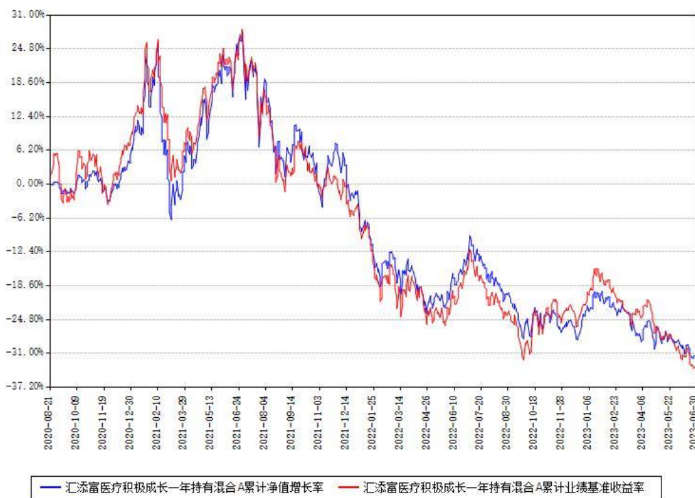
汇添富医疗积极成长一年持有混合A累计净值增长率与同期业绩基准收益率对比图