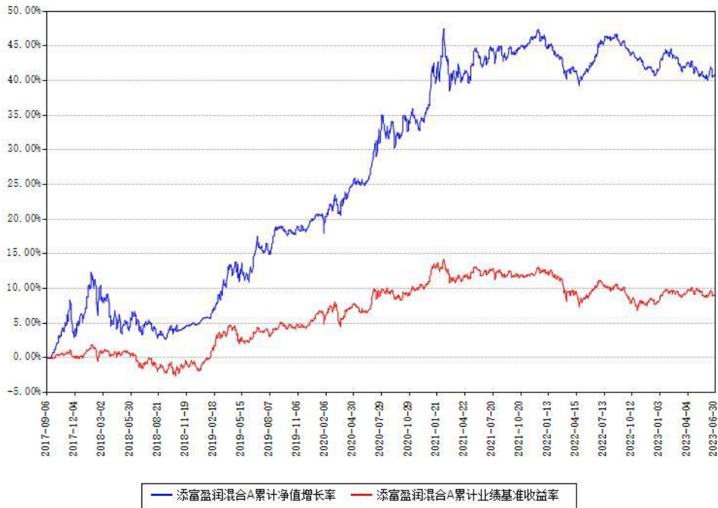
添富盈润混合A累计净值增长率与同期业绩基准收益率对比图