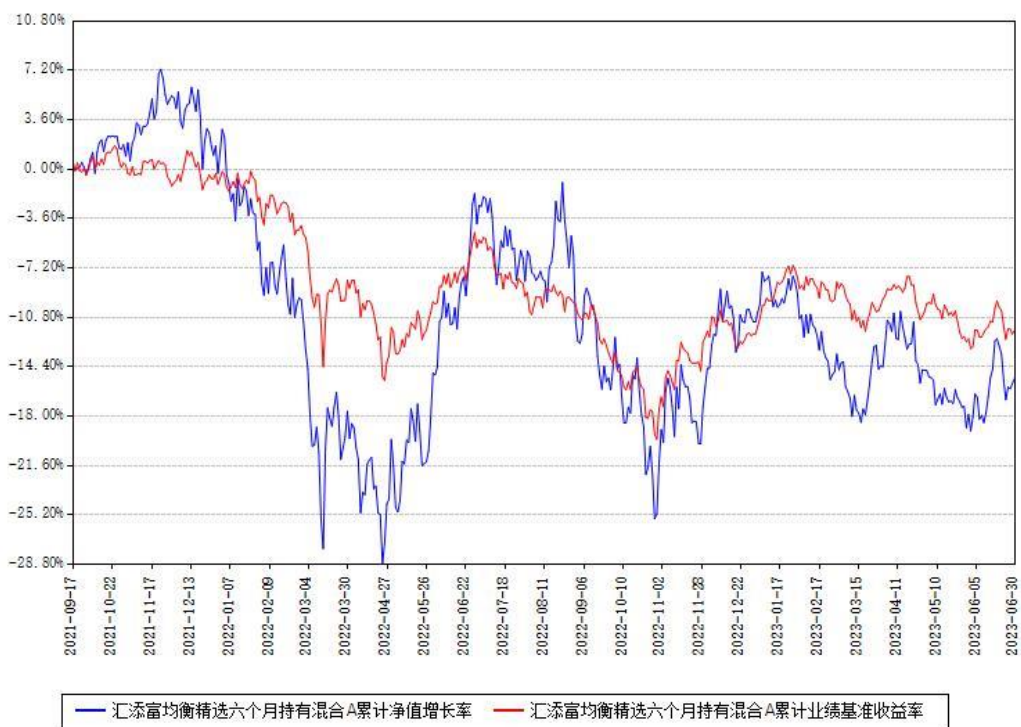
汇添富均衡精选六个月持有混合A累计净值增长率与同期业绩基准收益率对比图