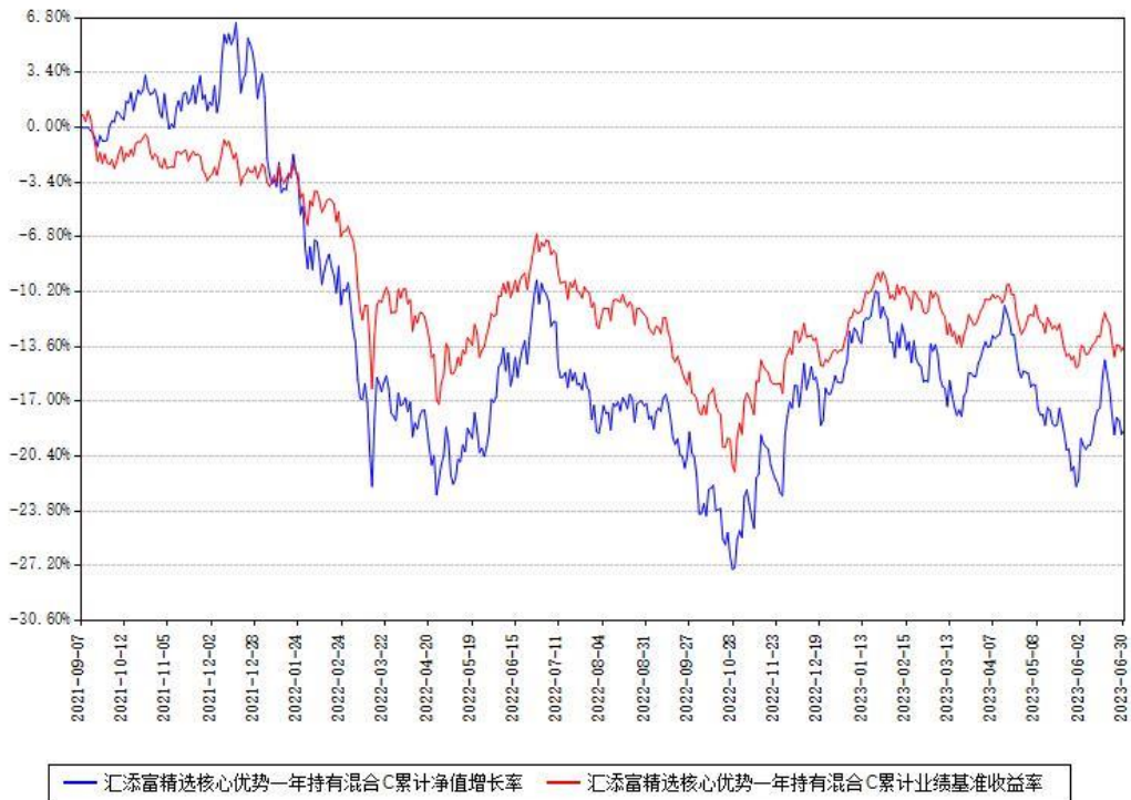
汇添富精选核心优势一年持有混合C累计净值增长率与同期业绩基准收益率对比图