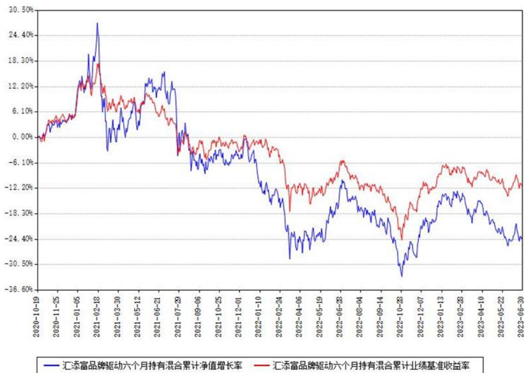
汇添富品牌驱动六个月持有混合累计净值增长率与同期业绩基准收益率对比图