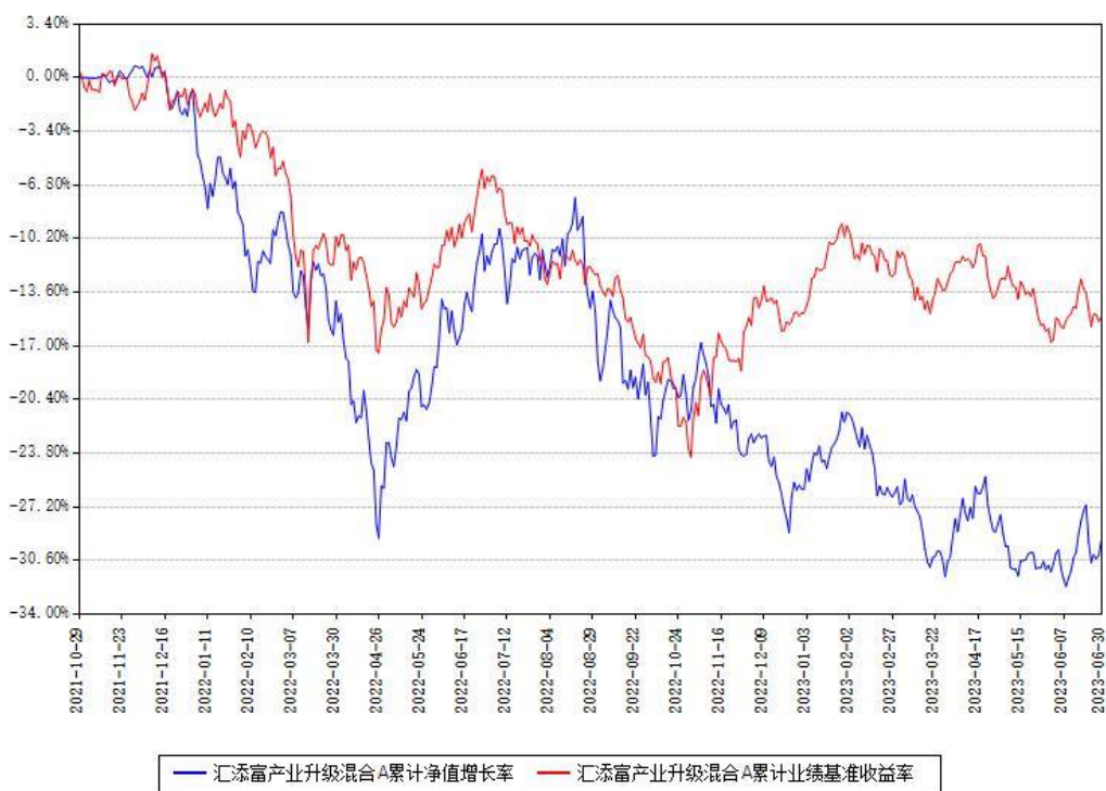
汇添富产业升级混合A累计净值增长率与同期业绩基准收益率对比图

(二) 自基金合同生效以来基金累计净值增长率变动及其与同期业绩比较基准收益率变动的比较图