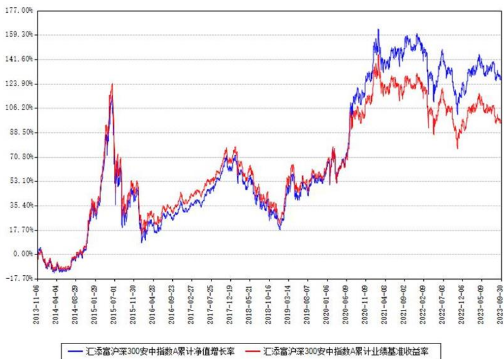
汇添富沪深300安中指数A累计净值增长率与同期业绩基准收益率对比图