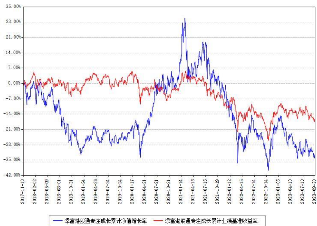
添富港股通专注成长累计净值增长率与同期业绩基准收益率对比图