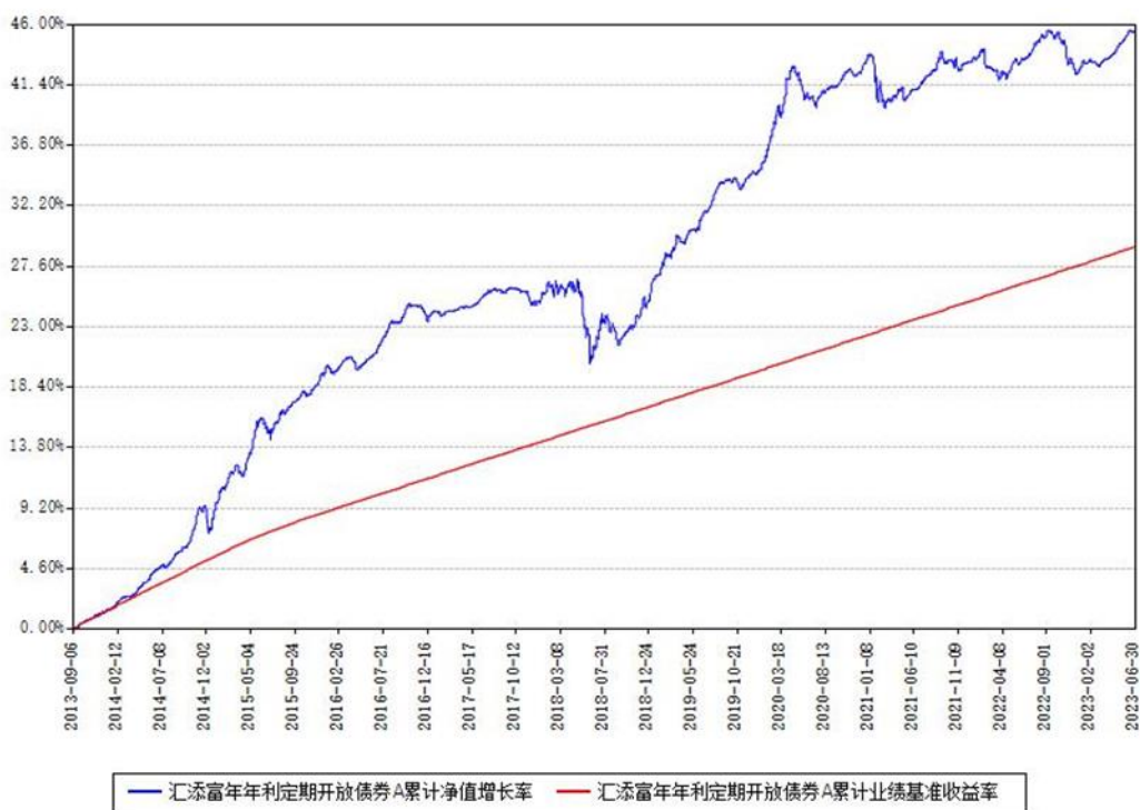
汇添富年年利定期开放债券A累计净值增长率与同期业绩基准收益率对比图