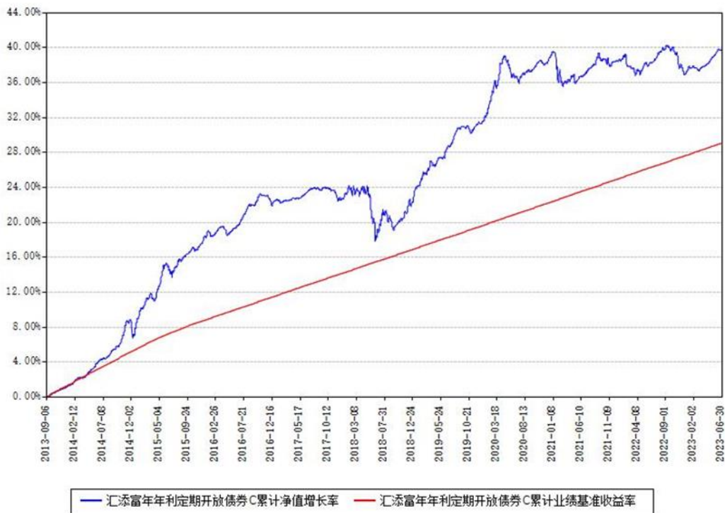
汇添富年年利定期开放债券C累计净值增长率与同期业绩基准收益率对比图