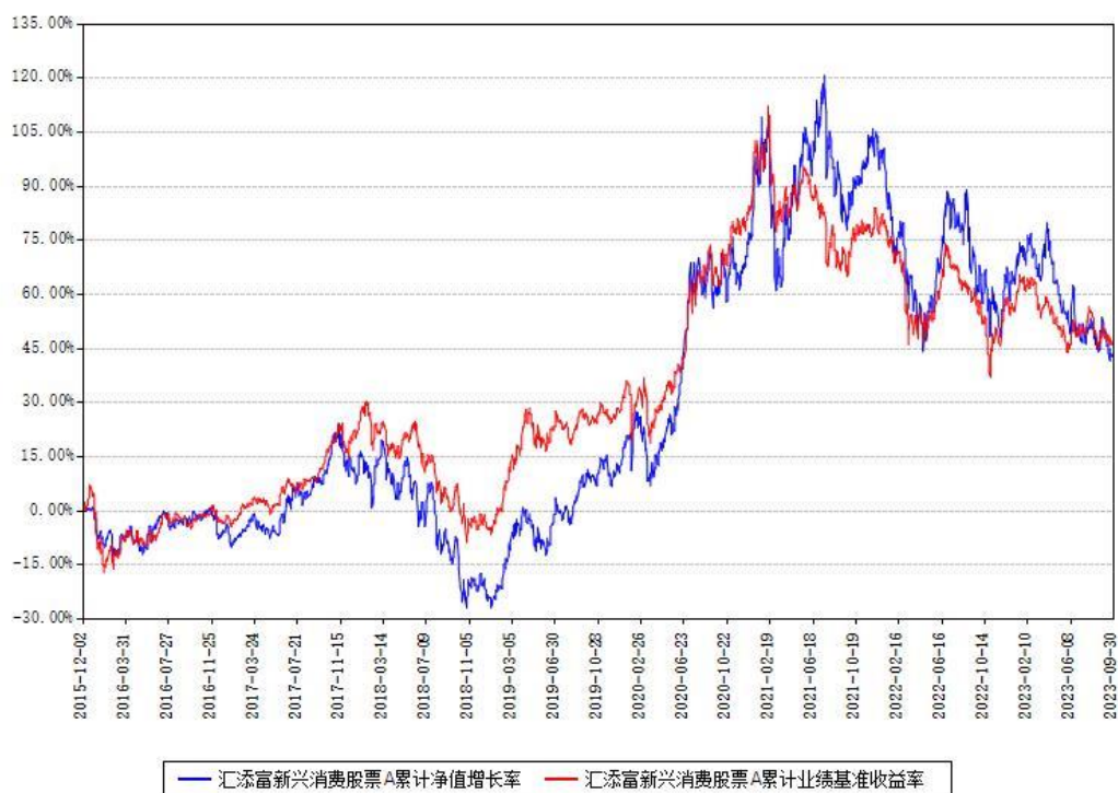
汇添富新兴消费股票A累计净值增长率与同期业绩基准收益率对比图

(二)自基金合同生效以来基金累计净值增长率变动及其与同期业绩比较基准收益率变动的比较图