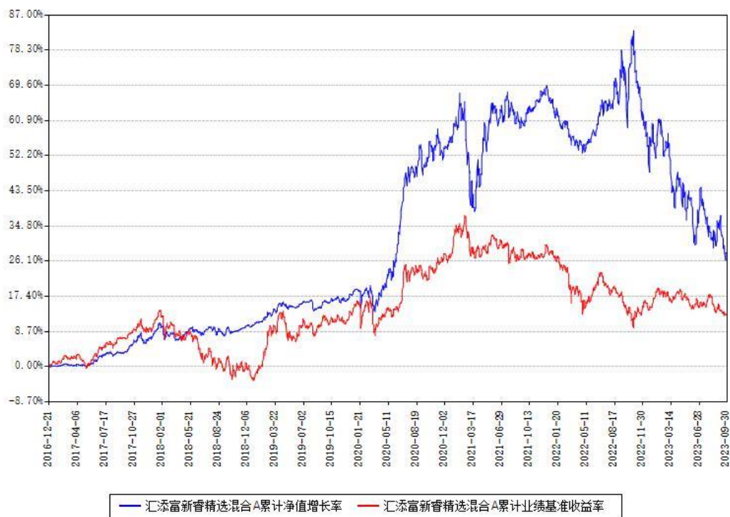
汇添富新睿精选混合A累计净值增长率与同期业绩基准收益率对比图

(二)自基金合同生效以来基金累计净值增长率变动及其与同期业绩比较基准收益率变动的比较图