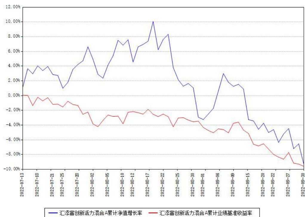
汇添富创新活力混合A累计净值增长率与同期业绩基准收益率对比图

(二) 自基金合同生效以来基金累计净值增长率变动及其与同期业绩比较基准收益率变动的比较图