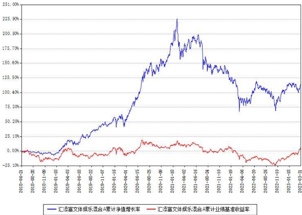
汇添富文体娱乐混合A累计净值增长率与同期业绩基准收益率对比图

(二)自基金合同生效以来基金累计净值增长率变动及其与同期业绩比较基准收益率变动的比较图