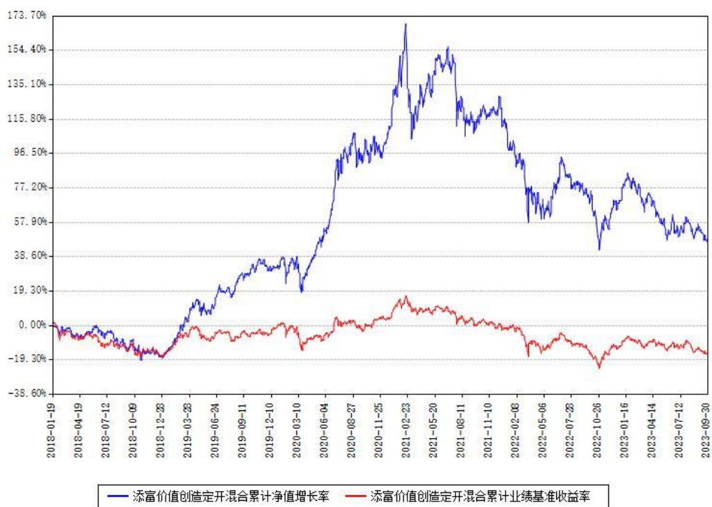
添富价值创造定开混合累计净值增长率与同期业绩基准收益率对比图