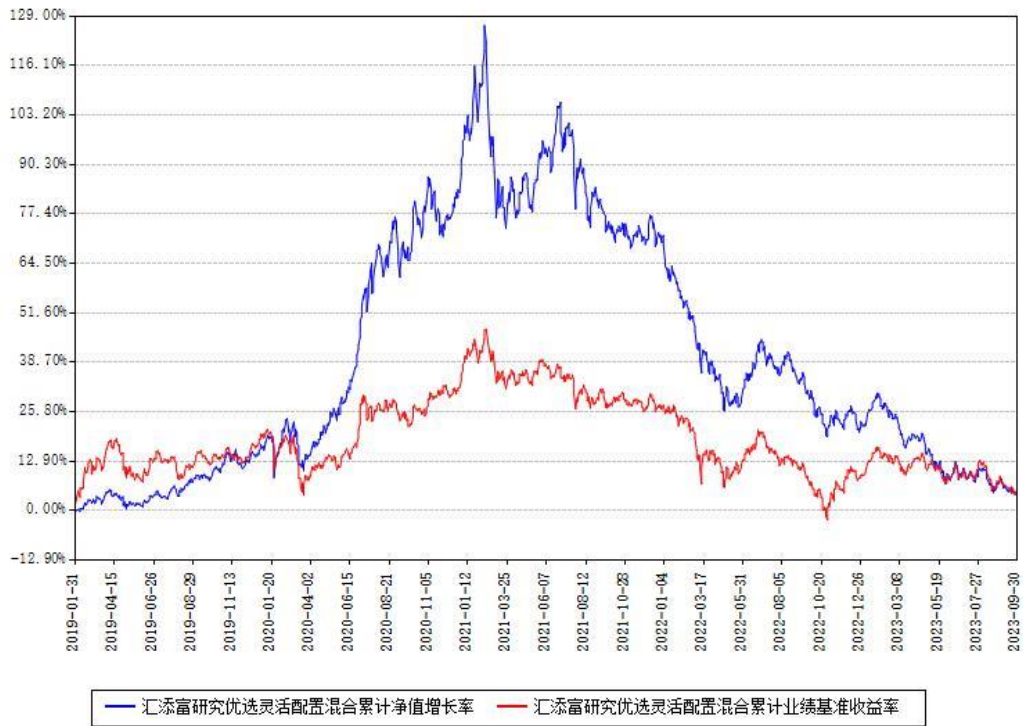
汇添富研究优选灵活配置混合累计净值增长率与同期业绩基准收益率对比图