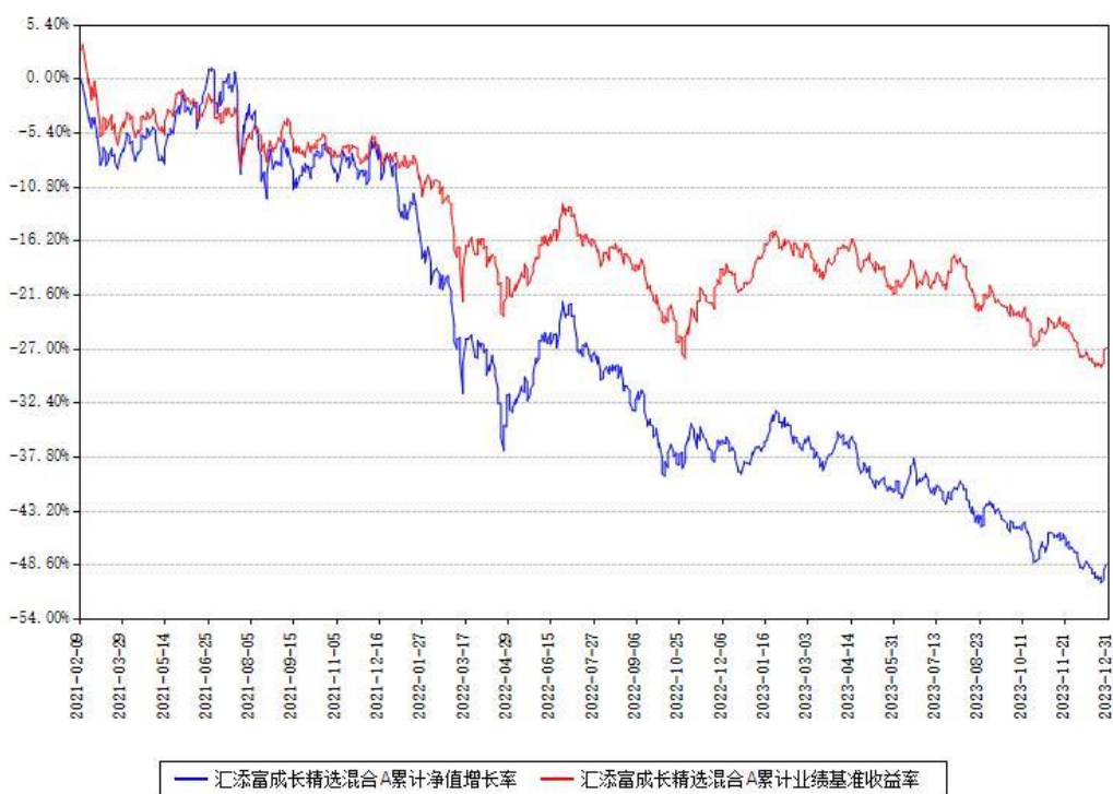
汇添富成长精选混合A累计净值增长率与同期业绩基准收益率对比图

（二）自基金合同生效以来基金累计净值增长率变动及其与同期业绩比较基准收益率变动的比较