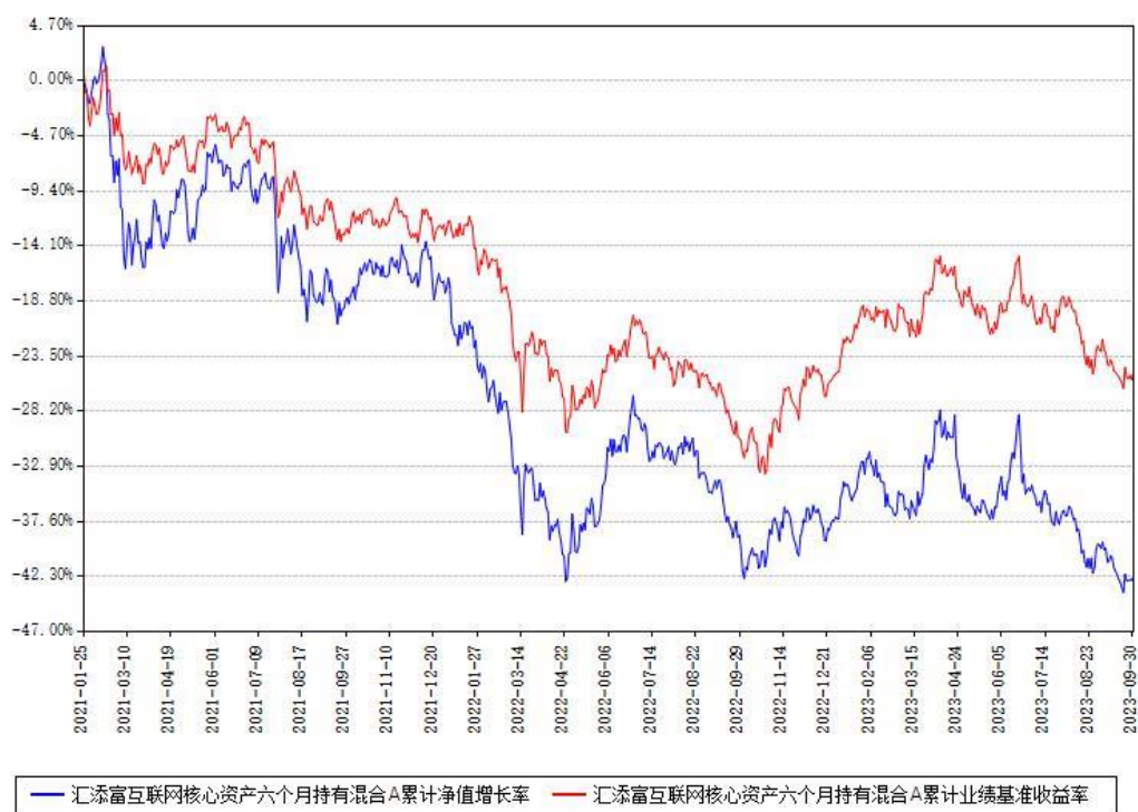
汇添富互联网核心资产六个月持有混合A累计净值增长率与同期业绩基准收益率对比图