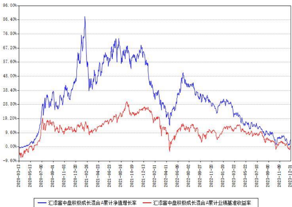
汇添富中盘积极成长混合A累计净值增长率与同期业绩基准收益率对比图

(二)自基金合同生效以来基金累计净值增长率变动及其与同期业绩比较基准收益率变动的比较图