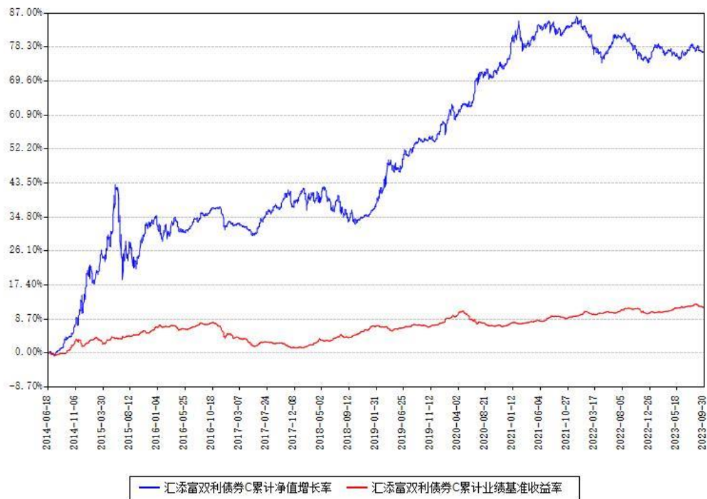
汇添富双利债券C累计净值增长率与同期业绩基准收益率对比图