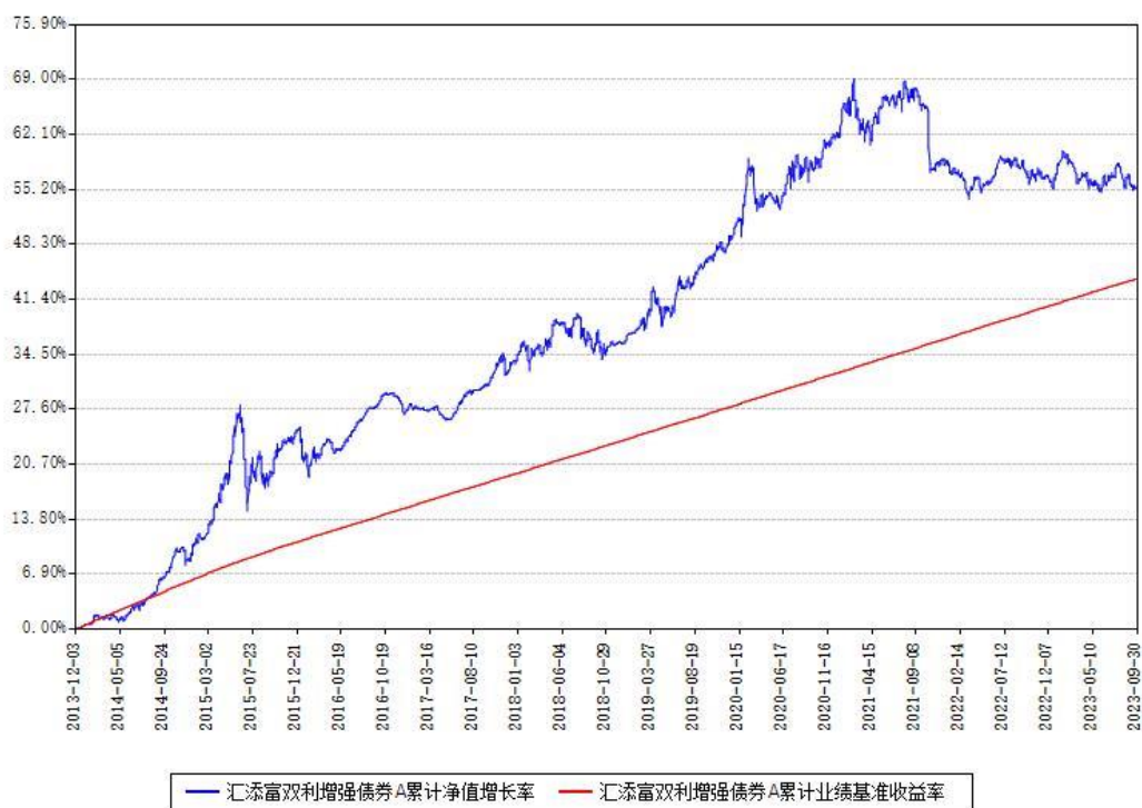
汇添富双利增强债券A累计净值增长率与同期业绩基准收益率对比图