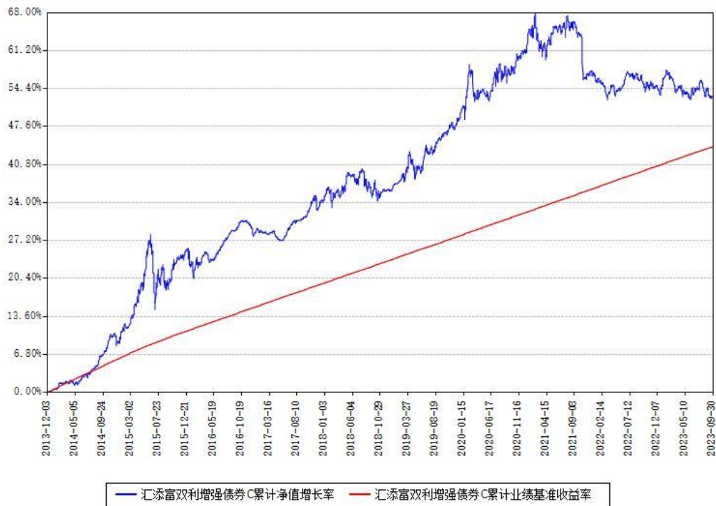
汇添富双利增强债券C累计净值增长率与同期业绩基准收益率对比图