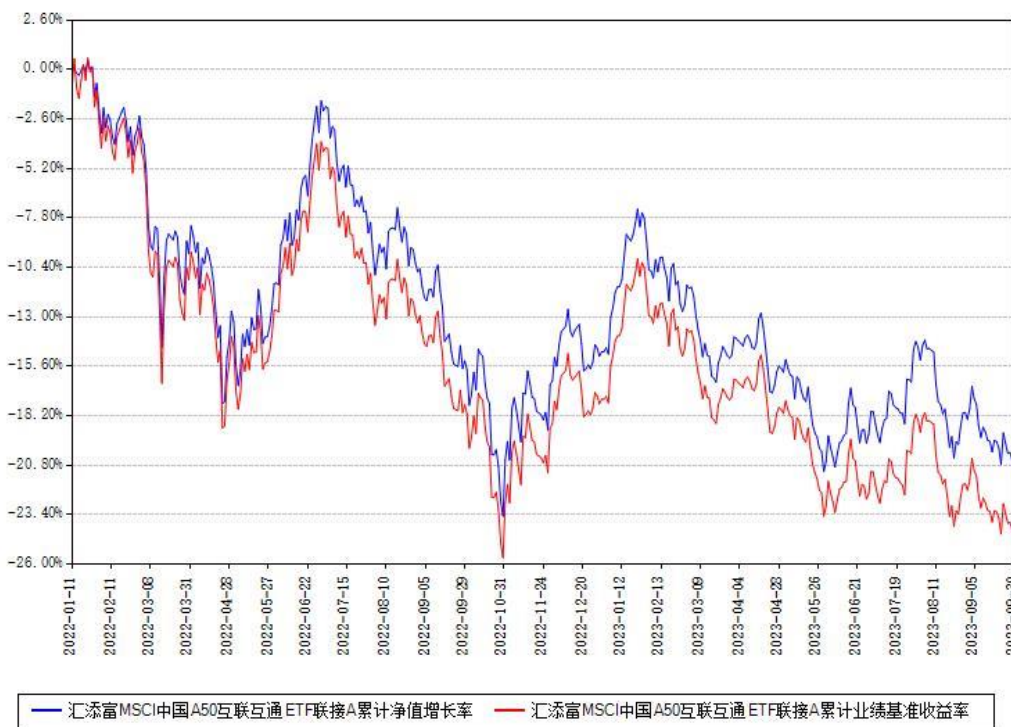
汇添富MSCI中国A50互联互通ETF联接A累计净值增长率与同期业绩基准收益率对比图