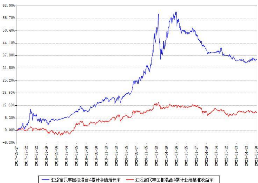
汇添富民丰回报混合A累计净值增长率与同期业绩基准收益率对比图