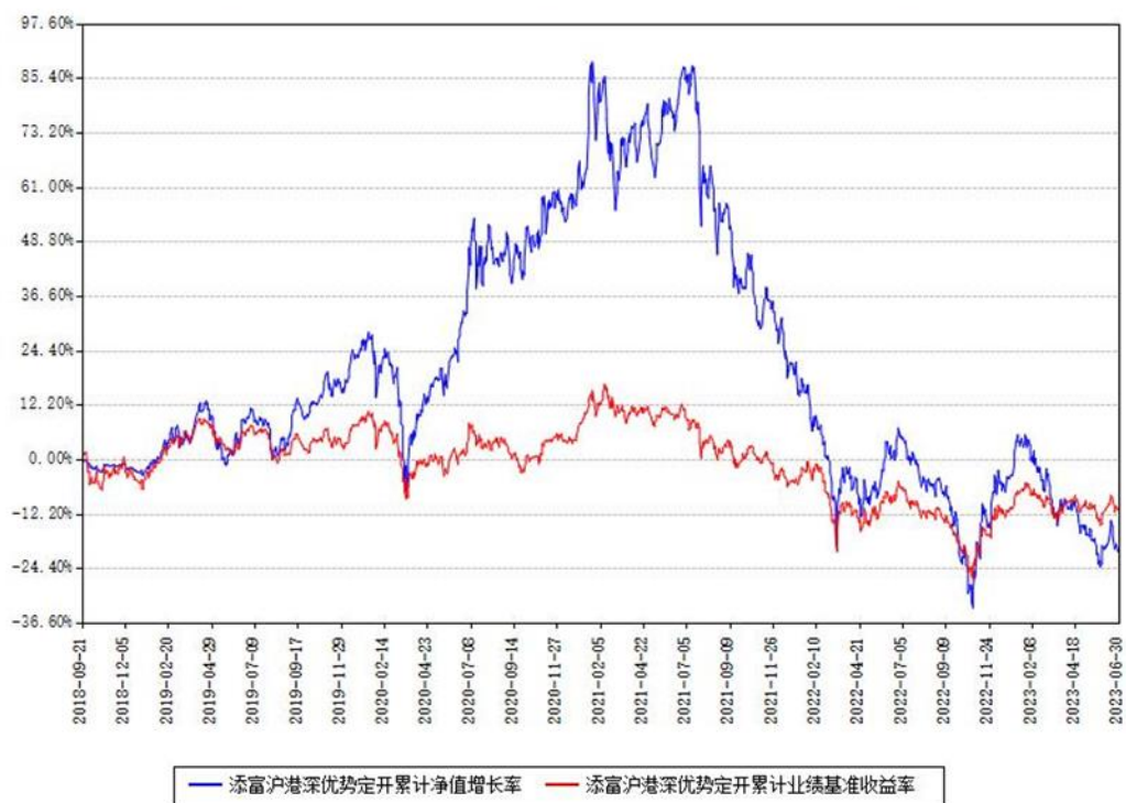
添富沪港深优势定开累计净值增长率与同期业绩基准收益率对比图