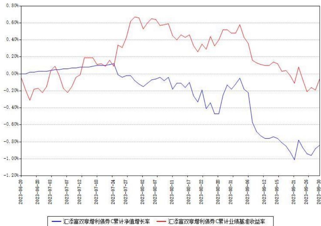
汇添富双享增利债券C累计净值增长率与同期业绩基准收益率对比图