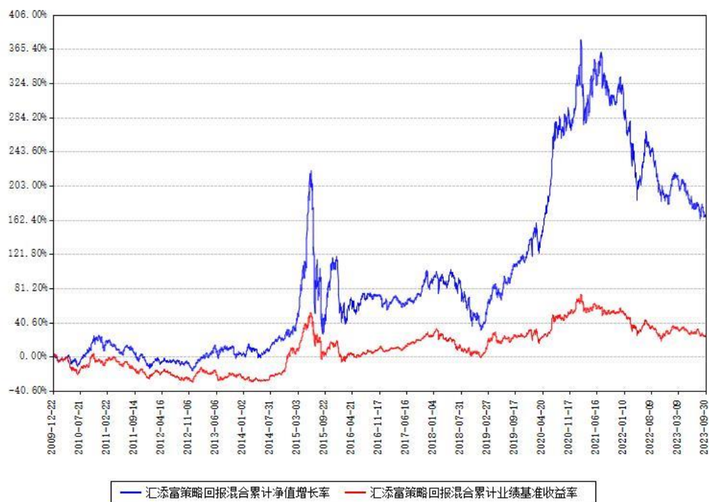
汇添富策略回报混合累计净值增长率与同期业绩基准收益率对比图

(二)自基金合同生效以来基金累计净值增长率变动及其与同期业绩比较基准收益率变动的比较图