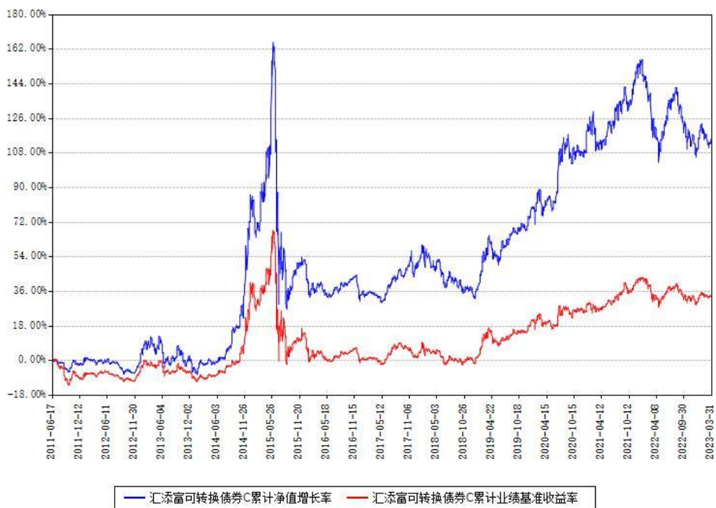
汇添富可转换债券C累计净值增长率与同期业绩基准收益率对比图