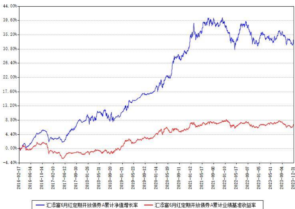
汇添富6月红定期开放债券A累计净值增长率与同期业绩基准收益率对比图