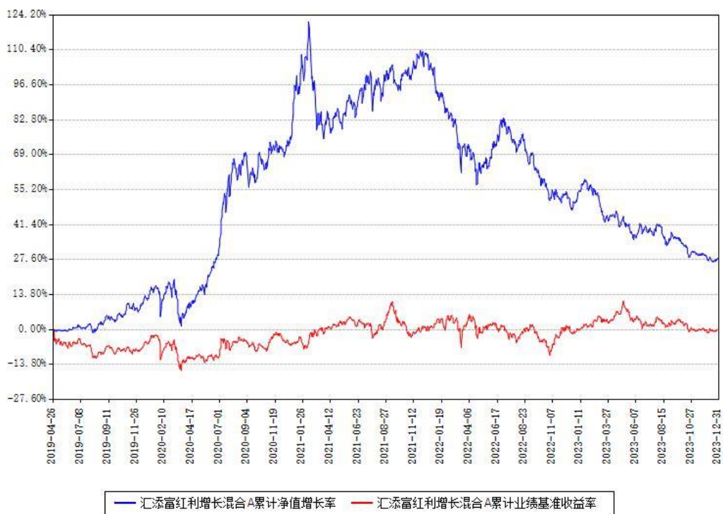
汇添富红利增长混合A累计净值增长率与同期业绩基准收益率对比图

(二)自基金合同生效以来基金累计净值增长率变动及其与同期业绩比较基准收益率变动的比较图